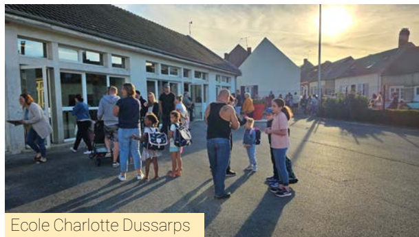
Ecole Charlotte Dussarps