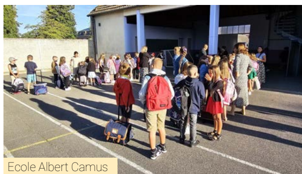
Ecole Albert Camus