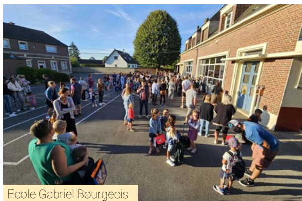
Ecole Gabriel Bourgeois