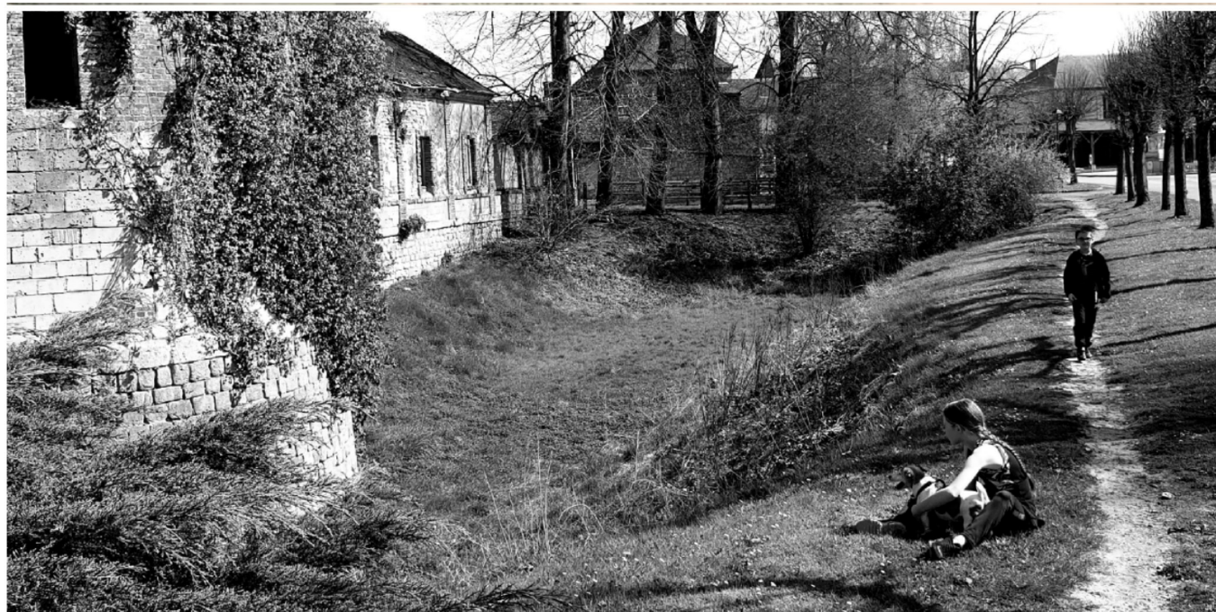
Les douves du château