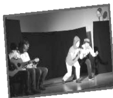
L'Art du Hasard